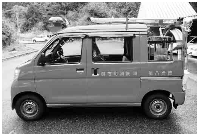
▲第8分団に配備された消防車両

町では、計画的に消防ポンプ車の更新を進めています。 平成27年度は、初年度登録から20年が経過している第8分団（実谷区・上布施区）の車両を更新し、軽四輪駆動小型動力ポンプ付積載車を新しく配備しました。 新車両の持つ機能を十分に発揮し、地域での防火・防災活動や日々の訓練によって減災に努めます。