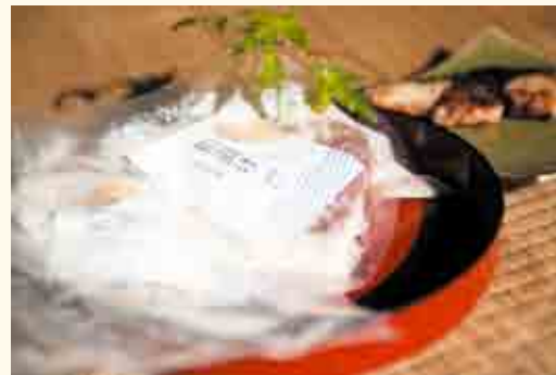
▲御宿産粕漬けラベル

制作協力 千葉工業大学工学部デザイン科学科 長尾教授 工業意匠研究室 一般社団法人御宿町観光協会、御宿岩和田漁業協同組合 翻訳協力 学校法人佐野学園 神田外語大学（韓国語・スペイン語翻訳）