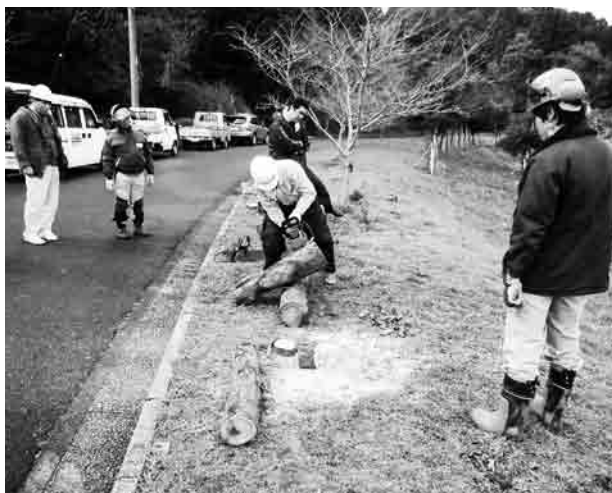
▲鋭い切れ味を体験