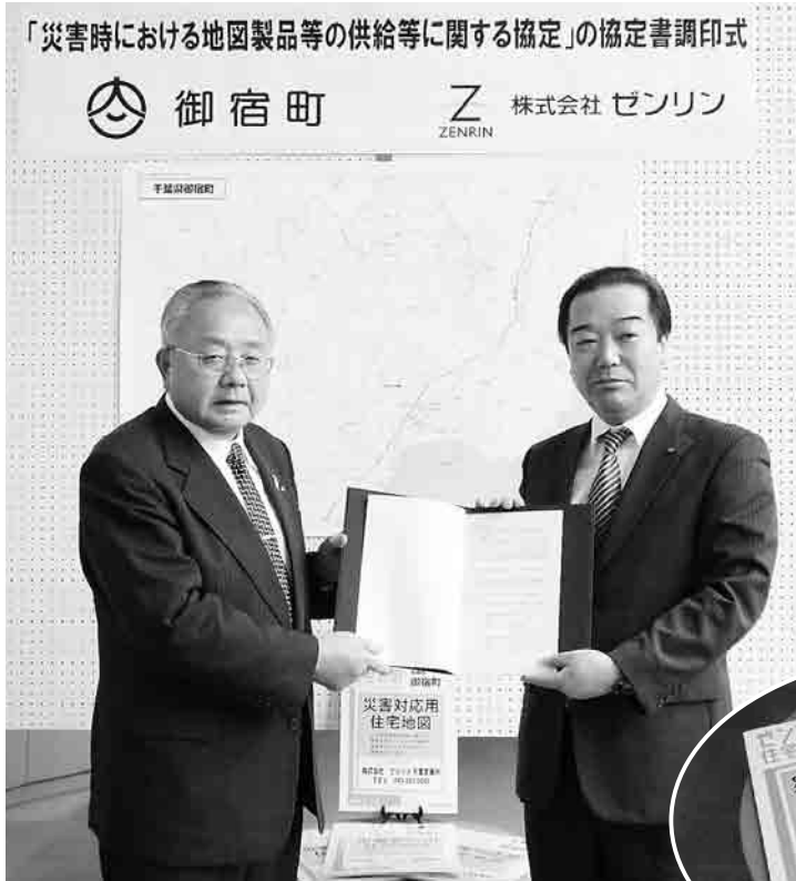
▲協定調印式の様子

災害時における地図製品等の供給等に関する協定を締結 3月24日(木)、株式会社ゼンリンと災害時における地図製品等の供給等に関する協定を締結しました。 協定の内容は、地震、風水害その他の災害時に、応急・復旧対策を円滑に実施する際に必要となる住宅地図等を確保し、即座に活用できるように事前に整備を行うものです。