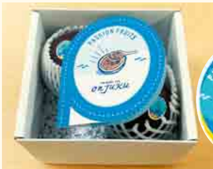
▲パッションフルーツ ラベル・パンフレット