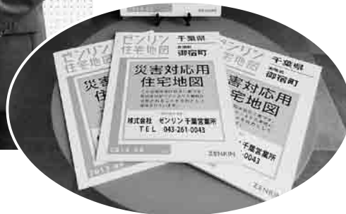
▲災害対応住宅地図

災害時における地図製品等の供給等に関する協定を締結 3月24日(木)、株式会社ゼンリンと災害時における地図製品等の供給等に関する協定を締結しました。 協定の内容は、地震、風水害その他の災害時に、応急・復旧対策を円滑に実施する際に必要となる住宅地図等を確保し、即座に活用できるように事前に整備を行うものです。