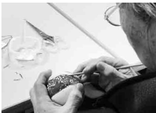
▲手先の運動のためのつるし雛作成

昨年度は「鶴亀くらぶ・教室」で、転倒予防や健康づくりを目的として、運動や体操、つるし雛作成・遠足等のレクリエーションを実施してきました。