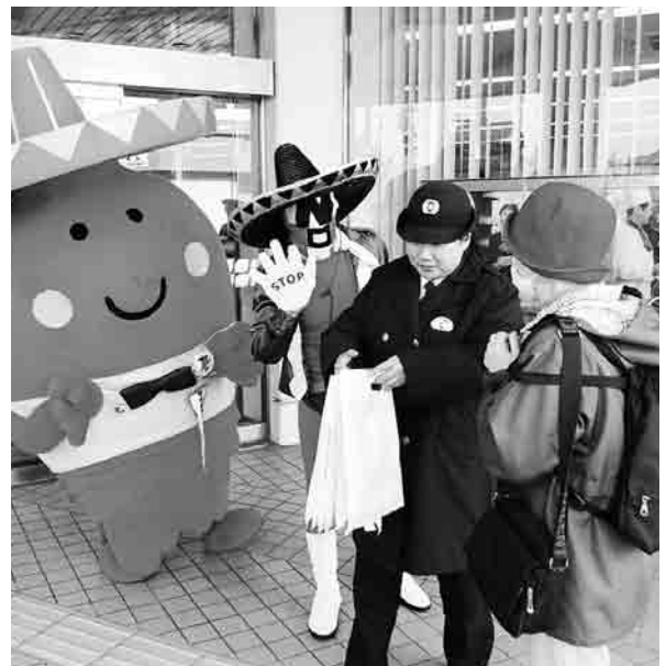
▲千葉銀行 御宿支店前でのグッズ配布

今後も町では関係機関と連携して定期的な悪質商法・電話de詐欺被害ゼロに向けた啓発に取り組み、被害を未然に防げるよう努めていきます。