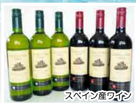
スペイン産ワイン