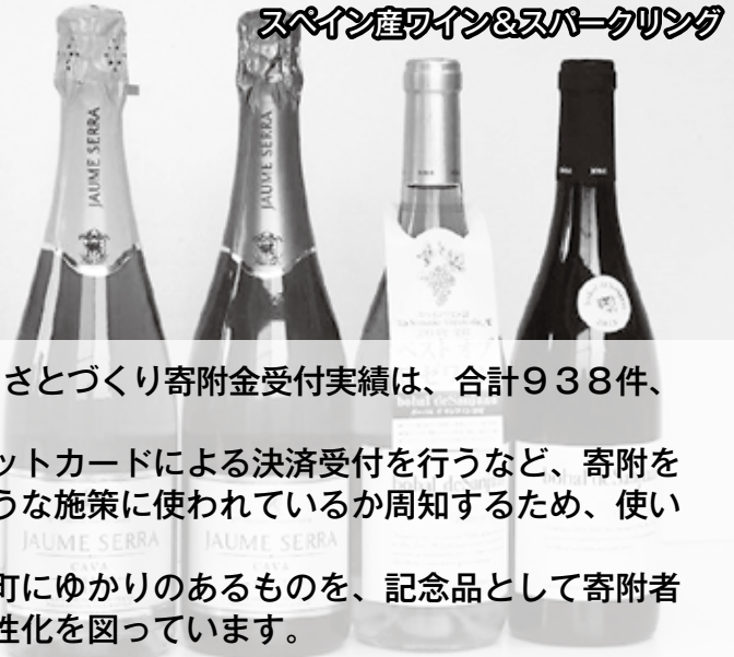
スペイン産ワイン&スパークリング

平成28年度4月から9月末までの御宿町活力あるふるさとづくり寄附金受付実績は、合計938件、1,757万円でした。