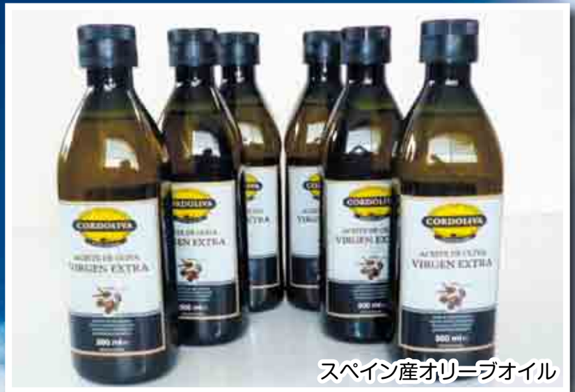
スペイン産オリーブオイル

記念品の提供を検討されている方は、役場企画財政課（☎68-2512）までご連絡ください。