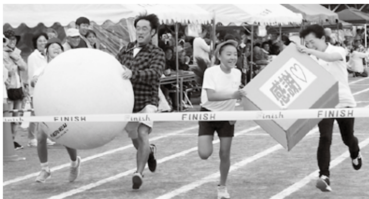
▲親子で力を合わせてゴールを目指します

パラパラと雨が降る中での開催となりましたが、児童たちの雨を吹き飛ばすような迫力のある応援と、各競技での活躍が見られました。