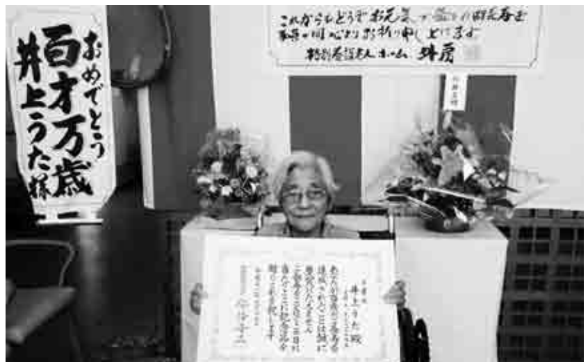
▲盛大にお祝いが行われました