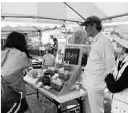
▲御宿台秋祭りで販売を行った記念品の一つ「御宿産純粋はちみつ」

記念品の提供を検討されている場合は、役場企画財政課ふるさと納税担当(☎68-2512)までご連絡ください。