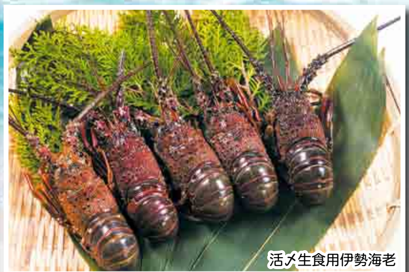
活メ生食用伊勢海老