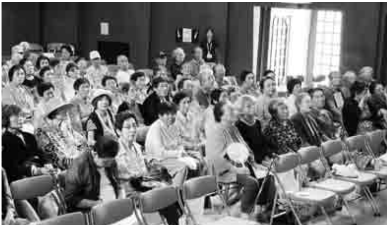
▲多くの方が参加されました

敬老会には70歳以上の方が大勢参加され、御宿児童合唱団のお祝いの歌にあわせて元気に歌ったり、踊ったりしていました。