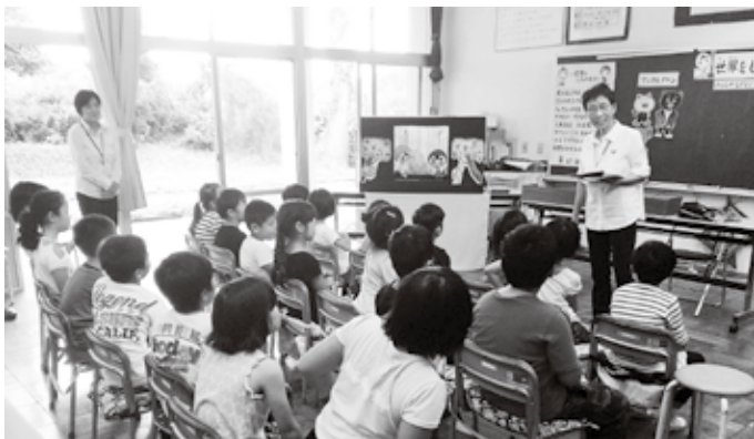
▲人権擁護委員による人形劇