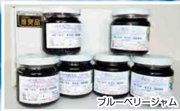
ブルーベリージャム