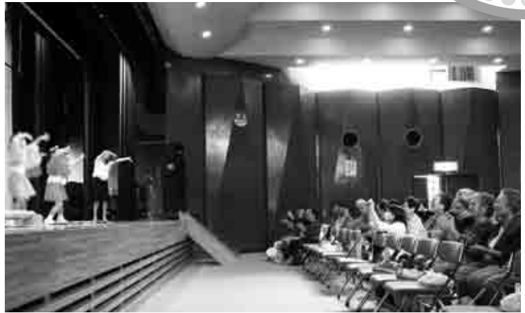
▲子供たちの振付にあわせて踊る様子

今年、御宿町では70歳以上の方が2,694名、そのうち90歳以上の方が266名、さらに100歳以上の方は16名となりました。