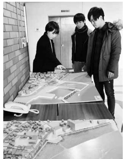
▲模型を使って説明する学生

下田研究室では、御宿町を魅力的なビーチタウンとして再生するための調査研究を行っており、今年で6年目となります。平成24年度は海岸一等地に立地する町営住宅のリノベーション、25年度は御宿駅西口の整備計画、26年度は御宿町の街並み景観の向上、27年度は海岸線の遊歩道の整備と月の沙漠記念館のリノベーション、28年度は御宿中央海岸パビリオン及びウォーターパーク基本構想、そして今年度は、御宿漁港内に海水を利用したオーシャンプールを整備する案と、砂浜に設置したボードウォークの延伸が提案されました。