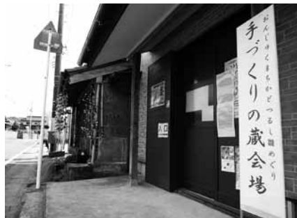
▲つるし雛めぐりのスタッフとして来場者の案内などを行いました

今年の1月から御宿町での生活を開始しています。地元のコミュニティのつながりの強さを感じる一方で、移住者も受け入れてくれるあたたかい御宿町の方たちに、いつも励まされています。