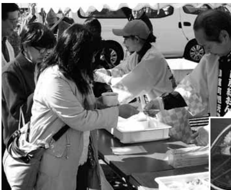
▲キンメ汁の無料配布にも長い列が

今年は新たに、地元スーパーおおたやと連携した特製きんめ鯛「こりゃ、うんめえ」弁当、近隣地区にある仕出料理店と連携したきんめ炊込みご飯が販売され、いずれも完売となりました。