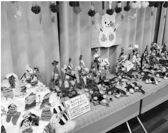
▲子どもたちの個性が光る作品

こども園では2月26日（月）から28日（水）まで、園児たちが日ごろ描いている絵や工作などの作品展を行いました。