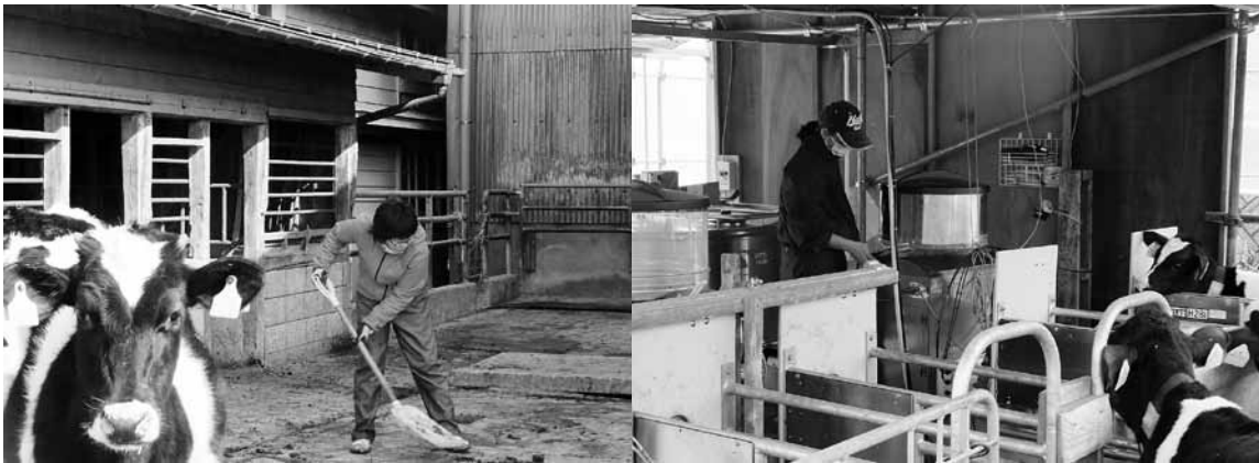
▲牛舎の掃除から機械操作まで何でも挑戦します