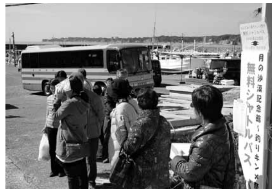
▲岩和田漁港駐車場とつるし雛めぐり会場である月の沙漠記念館を結ぶ無料シャトルバスを運行