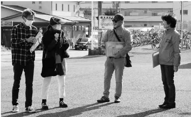
▲駅前でおもてなしをするボランティアスタッフ

今年度はボランティアを募集し、延べ157人の方が参加して、ピンク色のおそろいのジャンパーを着用し、街角でおもてなしをしました。多くの来場者から感謝の声をいただきました。