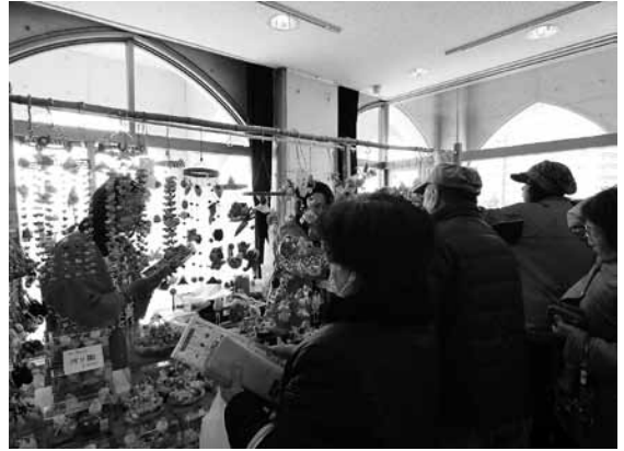
▲商工会女性部のつるし飾り販売コーナーは大盛況でした

また今年度も勝浦市で開催されたかつうらビッグひな祭りと共同開催となり、両イベント会場などを結ぶ無料バスが運行されました。