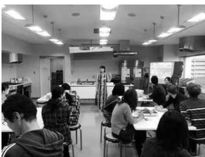
▲千葉市で開催したグローバルキッチンの様子

これまでは千葉市にてアジア・アフリカ・中南米・オセアニアの計14か国の食文化を紹介してきました。国際的な町、御宿をさらに盛り上げるべく、今後は御宿町公民館にて開催していきたいと考えています。