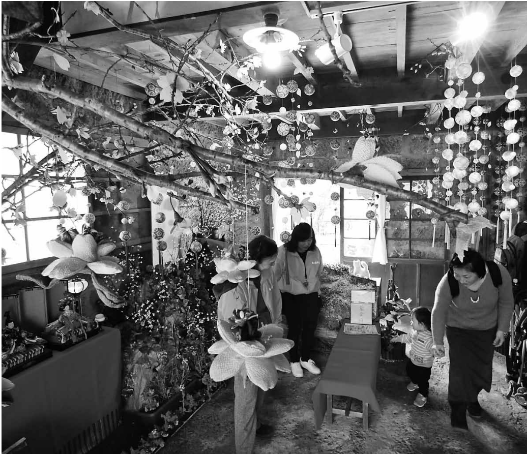
▲つるし雛めぐりにスタッフとして参加。来場者へのご案内などの活動を通じて、手づくりの蔵会場の飾りつけを担当した岩和田のお母さんたちや、町内から集まったボランティアの方々とも仲良くなりました。