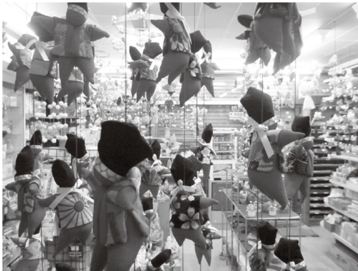
▲各店舗ならではのつるし雛が来場者をお出迎え

メイン会場である月の沙漠記念館、手づくりの蔵でつるし雛の展示や販売などが行われ、また町内協力店では展示のほか、期間限定の特別メニューやオリジナルグッズ・つるし雛制作キットの販売、制作体験など、店舗ごとに趣向を凝らした催しで来場者を楽しませています。