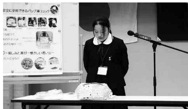
▲競技時間内に作品をつくり、発表を行いました