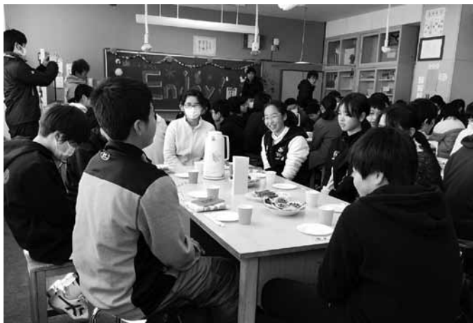
▲野沢温泉中学校で行われた歓迎式

1日目は晴天に恵まれ、輝く白銀の世界と青空のもと、両校の生徒たちは昨夏の出会いかから半年ぶりの再会を共に喜びました。歓迎式に始まり、野沢温泉中の生徒による村内散策などの交流を通して、夏の絆をさらに深めた様子でした。