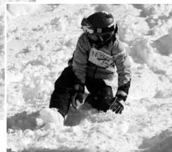
▲スキー教室の休憩時間にはあちこちで雪合戦が始まりました