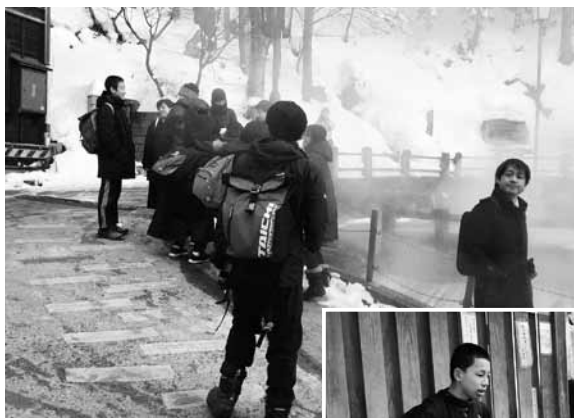
▲村内散策 (写真上) 源泉「麻釜」 (写真右) 足湯で一休み