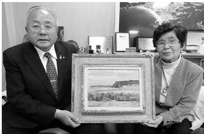
▲寄贈いただいた絵画