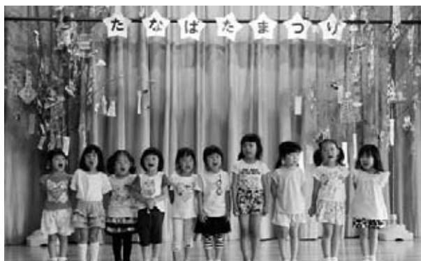
▲童謡「たなばたさま」を元気よく歌う園児たち

こども園内には七夕飾りが飾られ、「サッカーがもっと上手になりたい」など色とりどりの短冊に願いが込められていました。