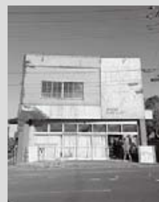
▲駅前拠点御宿 ベースキャンプ

駅前に新たにひとつ灯りを灯すことができるようになりました。これからの活用、地域の皆様と一緒に盛り上げていくことができれば幸いです。