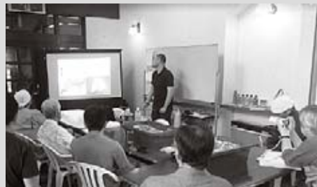
▲サイエンスカフェの様子

サイカス交流スペース（御宿台）にて、エビ・カニから見た外房の河川について、長年にわたって研究してきた講師よりお話があり、その後は会場に持ち込んだ生きた個体を観察しながら、さまざまな質疑応答が飛び交いました。定員以上の方にご参集いただき、皆さんの地域の自然に対する関心の高さを強く感じました。地味な淡水エビの中には、海と川を行き来する壮大な生活史を持つ種と、一生を淡水で過ごす種がいることや、講師の研究により明らかになった中国大陸原産のシナムマエビが外房河川で確認されていることなど、身近な生き物でありながら、あまり知られていない事実の数々に、参加者は興味津々でした。