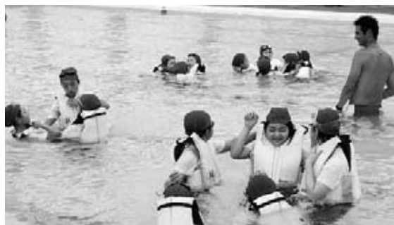
▲ライフジャケットを装着し、身の安全を守る浮力体験を実践

御宿小学校の児童を対象にサバイバルスイミングが7月5日、B & G海洋センターのプールで行われました。