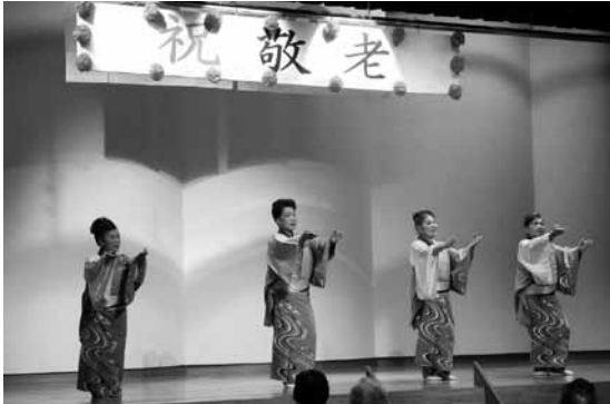
▲町内3団体による演芸が披露されました。

第65回敬老会が10月11日(金)に公民館で行われ、町内の70歳以上の方が参加されました。