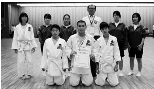
▲御宿中学校柔道部の皆さん

千葉県中学校新人柔道大会が10月19日(土)に千葉市で行われ、夷隅郡市の代表として御宿中学校柔道部が出場しました。