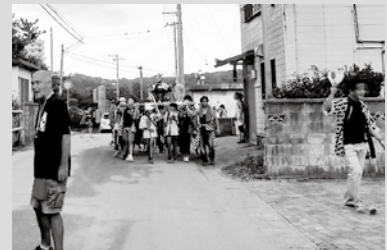
▲須賀小神輿の写真 (交通警備やりながら撮りました)

さて、グッドネイバーズでも台風等の影響でお休みが続いていた朝活が再開しました。第1・第3水曜日の朝7時から行っている勉強会ですが、11月は毎週水曜日と不定期でも開催の予定です。ぜひお気軽にグッドネイバーズにお立ち寄りください。