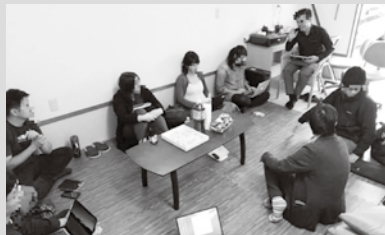
▲定例会の様子 (今回は南房総市にて行われました)

今後も横のつながりを大切に、町民の皆さんに還元できるよう、人脈を広げていきたいと思っています。