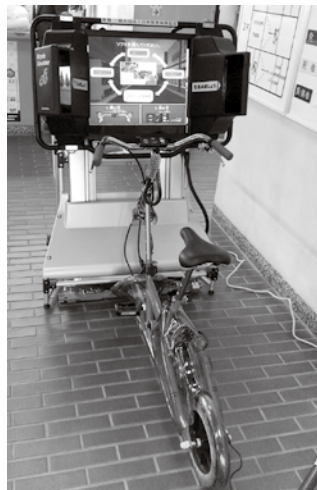
▲自転車シュミレータ

交通安全教育用資機材の贈呈式が10月23日(水)、いすみ警察署で行われ、一般社団法人日本損害保険協会からいすみ交通安全協会に自転車シュミレータが受贈されました。