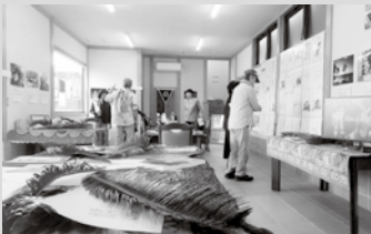
▲バヌアツ展の様子

10月17日～23日の一週間、御宿町浜地区にて「世界一幸せな国 バヌアツ展」を開催しました。(バヌアツ・ナバンガ ピキニニ友好協会主催) 物質的には決して恵まれていない生活を