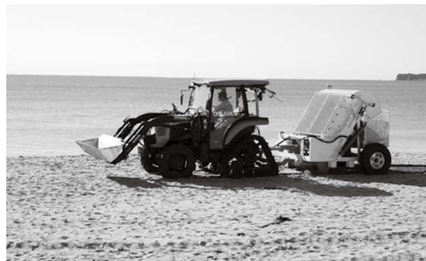
▲中央海岸の砂浜を清掃するビーチクリーナー