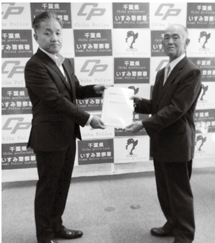
▲いすみ交通安全協会長(右)に 使い方のマニュアルが渡され ました。