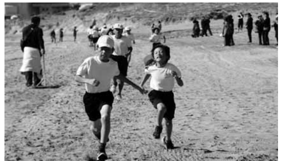
▲ゴールを目指して懸命に走りきりました。

ゴール後には観光協会から伊勢えび汁が振る舞われ、児童たちは美味しそうに食べていました。