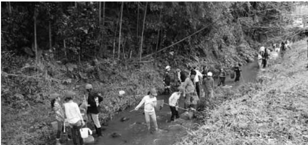
▲児童たちは興味を持って生き物を観察していました。

この自然観察会は川辺の生き物を見て直接手で触れ、自然に親しみながら地域の自然環境保護などについて学ぶことを目的としています。