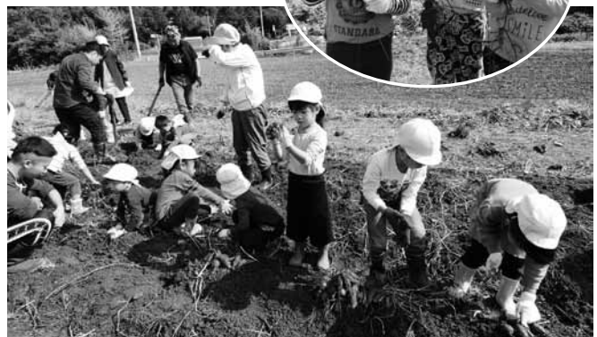
▲軍手をはめ、さつまいもを掘り起こす園児たち