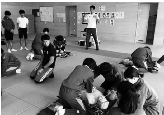
▲生徒たちは真剣に講習を受講しました。

御宿中学校3年生を対象とした救急救命講習が10月28日（月）、御宿中学校で行われました。