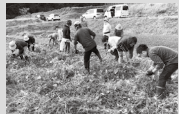
▲収穫のお手伝いをしました