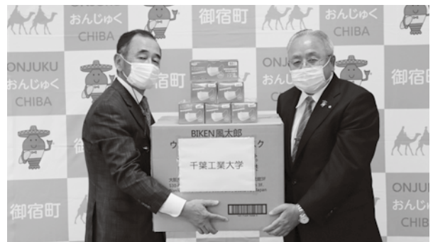
▲千葉工業大学からマスクを受け取りました。

千葉工業大学では昨年の台風で被害を受けた地域を中心に、包括連携協定を結ぶ県内8市町村に約4万枚を寄贈したとのことでした。