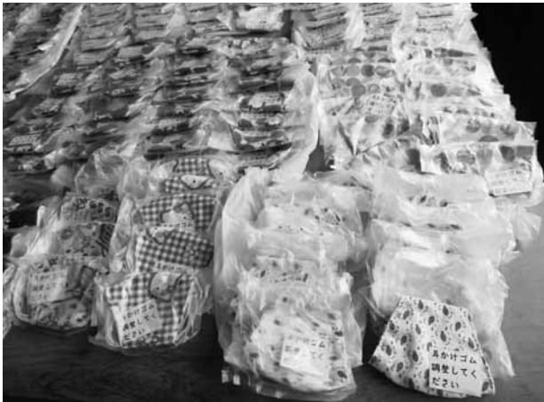
▲様々な可愛らしい柄で作られた手づくりマスク

町内小中学校の授業が再開した6月1日(月)、手作りマスク190枚が匿名で御宿小学校に寄贈されました。