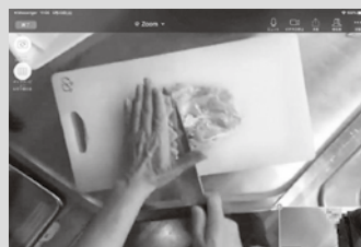
▲鶏肉の処理方法など、大変勉強になりました。

今後開催予定のイベント等の情報を、町民の皆さんが見つけやすくなる仕組みを現在考えていますので、この場をお借りしてまたお伝えできればと思います。