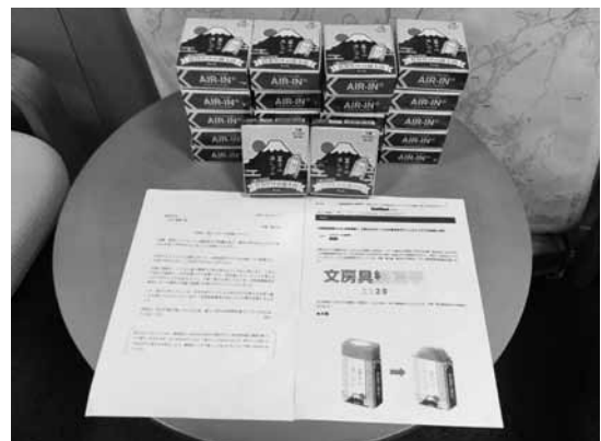
▲消し心地が抜群な「富士山消しゴム」

開発者は千葉工業大学大学院の卒業生で、消すことを楽しみながら自分だけの富士山を作り、勉強を一層楽しんでもらいたいという思いが込められています。