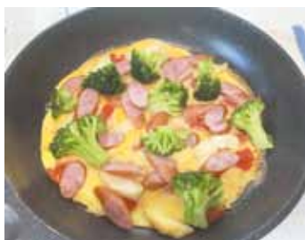
ジャーマンポテトオムレツ

今回のレシピは、彩りの良いオープンオムレツです。主菜と副菜の両方の食材を使っているため栄養バランスもよく、簡単に作ることができるので、忙しい朝の食事にもおすすめです。