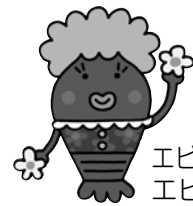
エビアミーゴの母 エビマードレ