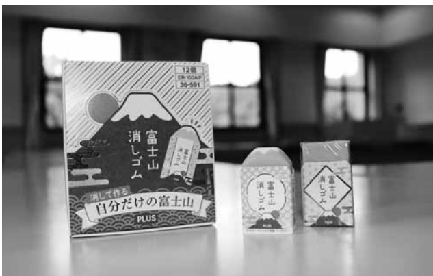
▲前後左右バランス良く消すと先端が富士山の形になります。